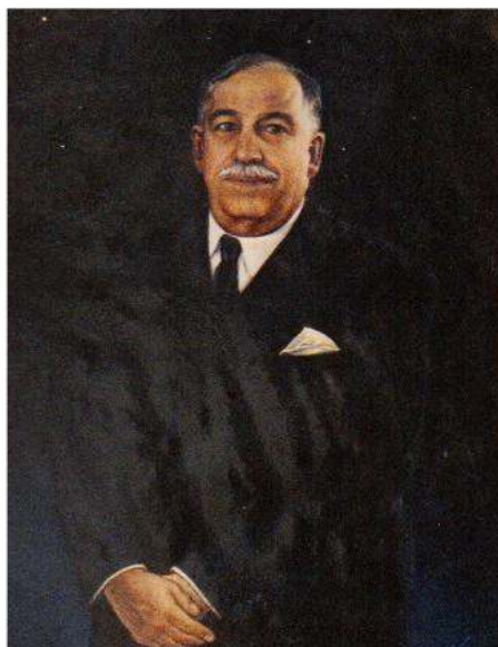
DR. LUIS ALBERTO DE HERRERA