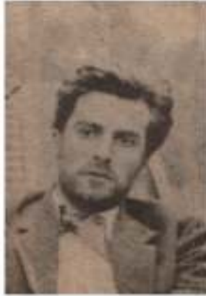
DR. WASHINGTON BELTRÁN

Fallece el Dr. Washington Beltrán por las heridas recibidas tras haberse batido a duelo con José Batlle y Ordóñez (2 de abril).