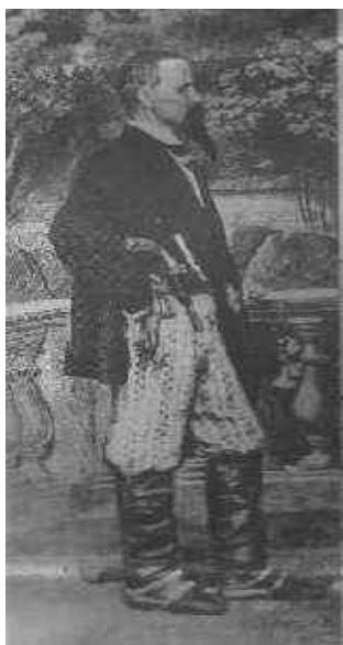
Gral. Leandro Gómez

Leandro Gómez es designado Comandante Militar de Paysandú (diciembre).