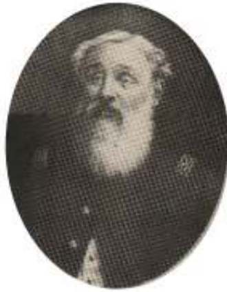
GRAL. TIMOTEO APARICIO

Es asesinado Bernardo P. Berro en Montevideo cuando lideraba la revolución contra la dictadura de Flores (febrero 19). Tras el asesinato de Venancio Flores, Lorenzo Batlle asume como presidente constitucional (marzo 1°). Rebelión de Máximo Pérez (mayo).