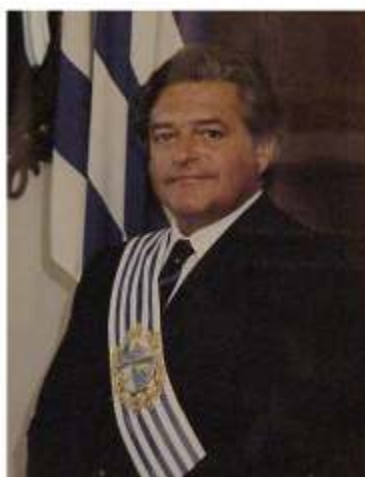
DR. LUIS ALBERTO LACALLE

El Partido Nacional triunfa en las elecciones nacionales con el 38,8% de los votos frente al 30,2% del Partido Colorado. La fórmula de los Dres. Luis Alberto Lacalle y Gonzalo Aguirre resulta la mayoritaria en filas del Partido Nacional con un 58,07% de los votos nacionalistas (26 de noviembre de 1989).