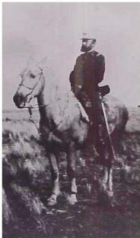
CNEL. DIEGO LAMAS

Fallece el Cnel. Diego Lamas (20 de mayo). Aparicio Saravia recibe la espada del Gral. Leandro Gómez (28 de agosto).