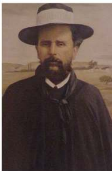
GRAL. APARICIO SARAVIA