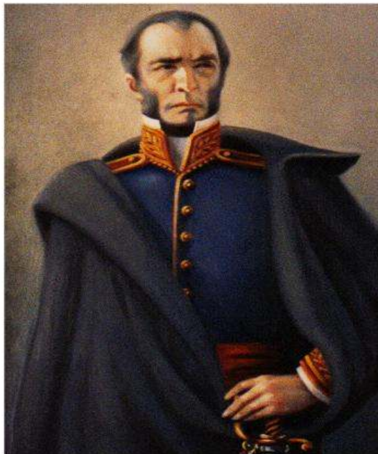
Brig. Gral. Juan Antonio Lavalleja

Realizadas elecciones para restaurar la legalidad en la República Oriental, bajo el signo de la "fusión" y del olvido del pasado. Recrudescen las disputas entre los antiguos bandos. Incidente del 18 de julio en la Plaza Matriz. Oribe, amenazado en su seguridad personal, se traslada a San José y, finalmente, se embarca rumbo a Barcelona (octubre). Fallecimiento de Lavalleja (octubre 22).